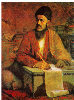
Портрет Махтумкули в исполнении А. Хаджиева. 1947 г.

Вторая половина XVIII в. была в истории туркмен периодом захватнических набегов соседних стран и периодом, когда туркмены жили племенами, а не было государственности, вследствие чего проливалась кровь. Об этом Махтумкули писал стихи и призывал к объединению туркмен: