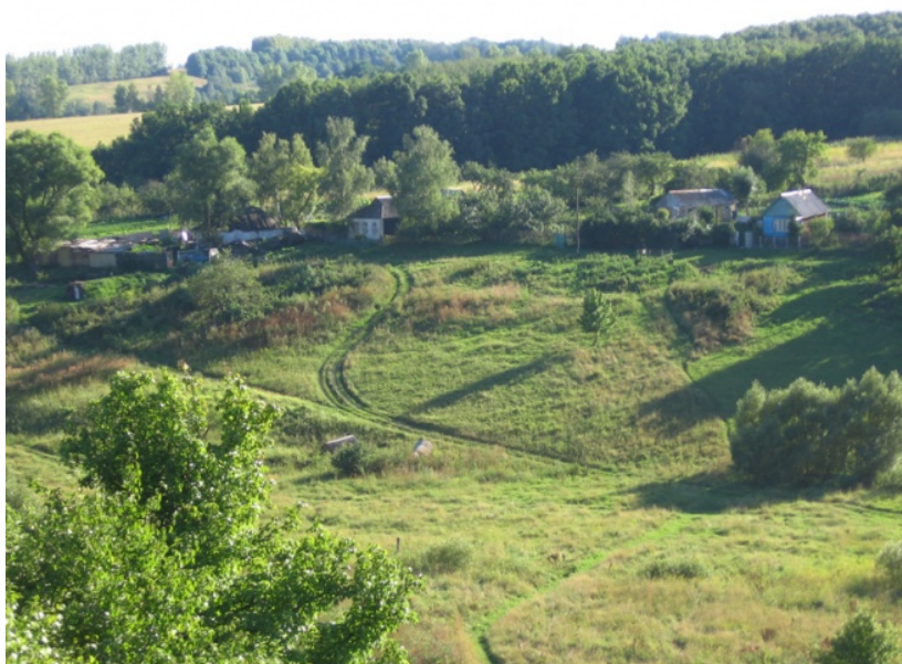
Рис. 1. Деревня Кожля

Богатые залежи глины позволили здесь, в этой деревне, на юго-западной окраине Курской губернии, процветать гончарному ремеслу. Игрушки создавали преимущественно женщины, мужчины занимались добычей глины или лепили более серьезные и тяжелые предметы.