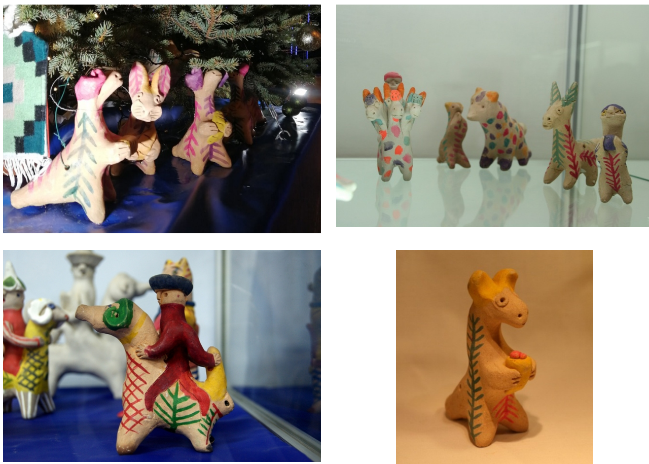
Рис. 2. Кожлянская игрушка

Таким образом, свое название деревня Козля , по всей видимости, получило от слова козёл со значением ‘приспособление из жердей, бревен, колов, плах, сделанных из древесины ели для просушки груды приготовленной глины’ (вепс. kuzžom ‘ельник, еловый лес’, саам. kuossa, guossâ ‘ель’, фин. kuusi , кар. kuuži, kuuzi , ливв. kuuzi , люд. Kūž – ‘ель’). Гончары выдерживали глину на открытом воздухе в так называемом глиннике – специальной яме, стены которой делали из жердей, бревен, плах или толстых досок. Глина должна была находиться в глиннике не менее трех месяцев, но порой ее держали в открытом хранилище по нескольку лет. Древесина для этих целей должна быть очень крепкой. Писатель И.С. Соколов-Микитов так образно показал ценность древесины хвойных деревьев: «Путешествуя по нетронутым человеком глухим лесам, я видел сосны, умершие на корню своей естественной смертью. Пропитанные смолой стволы этих деревьев высились над макушками окружавшего их живого леса. Сильные зимние ветры давно обломали их мертвые голые сучья, но пропитанный смолой ствол прочно стоял, быть может, десятки и сотни лет. Некоторые стволы упавших мертвых деревьев, покрытые зеленым мхом, лежали на земле. Я с трудом перебирался через них. Теперь таких нетронутых лесов осталось очень мало, и вряд ли кто видел стоящий на корню, пропитанный смолой ствол мертвой сосны» [4].